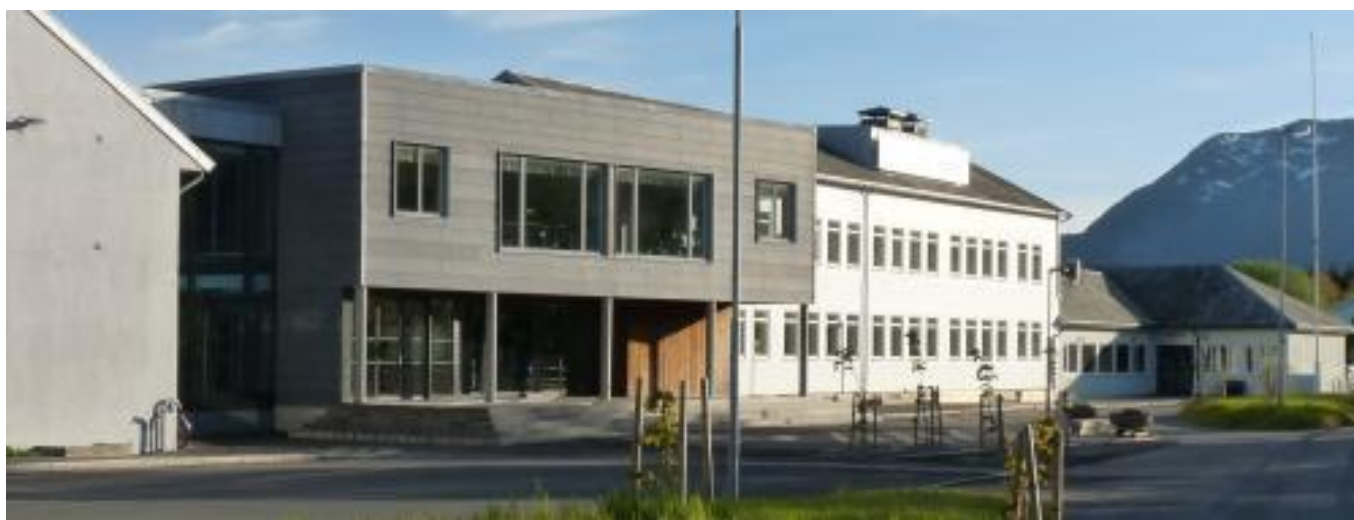
Vega barne- og ungdomsskole -våren 2020