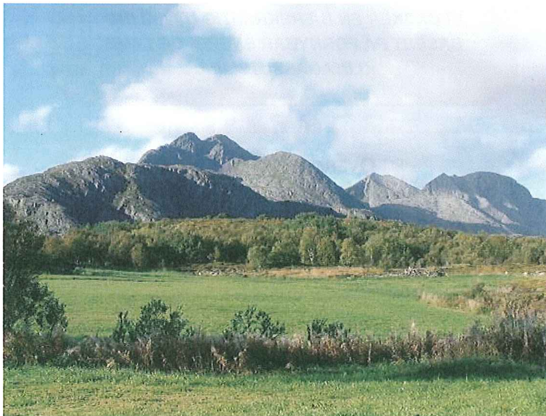
Fra Vega kommune

Identifisere og realisere gode prosjekter i samarbeid med bedrifter, næringsorganisasjoner og undervisningsinstitusjoner i regionen. Hensikt; Redusere energibruk og stabilisere utslipp av klimagasser på 1990-novå innen 2015.