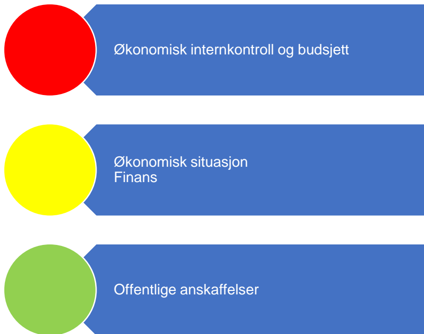
Figur 2. Risikovurdering økonomi

Figur 1 er en oppsummering av risikovurderingene som er gjort relatert til økonomi og i fortsettelsene presenteres bakgrunnen for vurderingene.