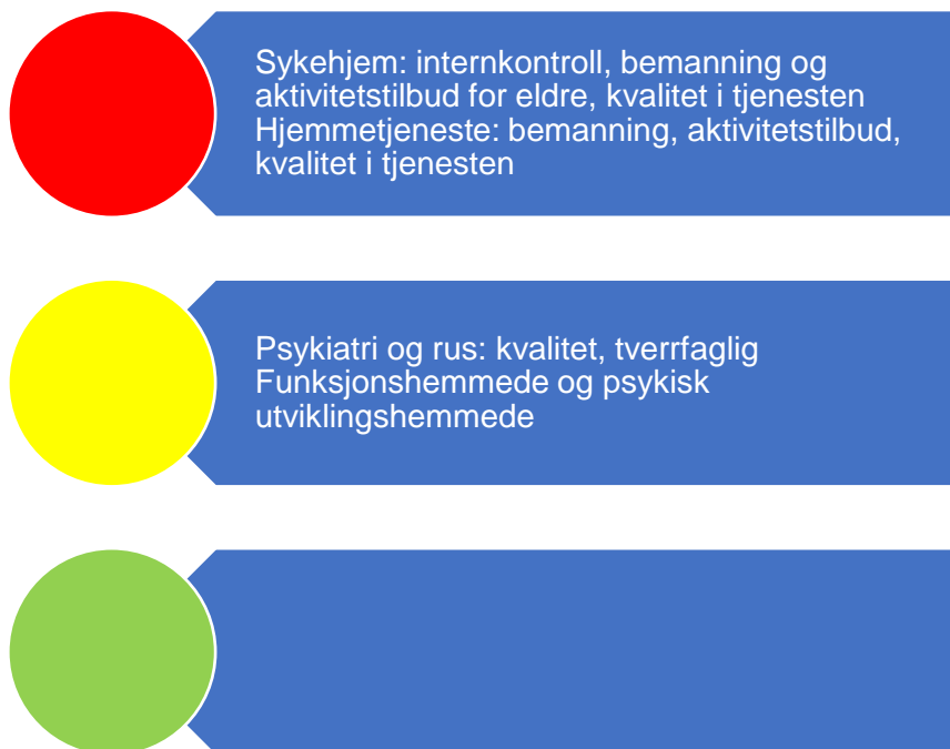
Figur 6. Risikovurdering helse og omsorg

I figur 6 er risikovurderingen innenfor helse- og omsorgstjenester oppsummert. I fortsettelsen følger en nærmere beskrivelse av data som er grunnlag for vurderingen.