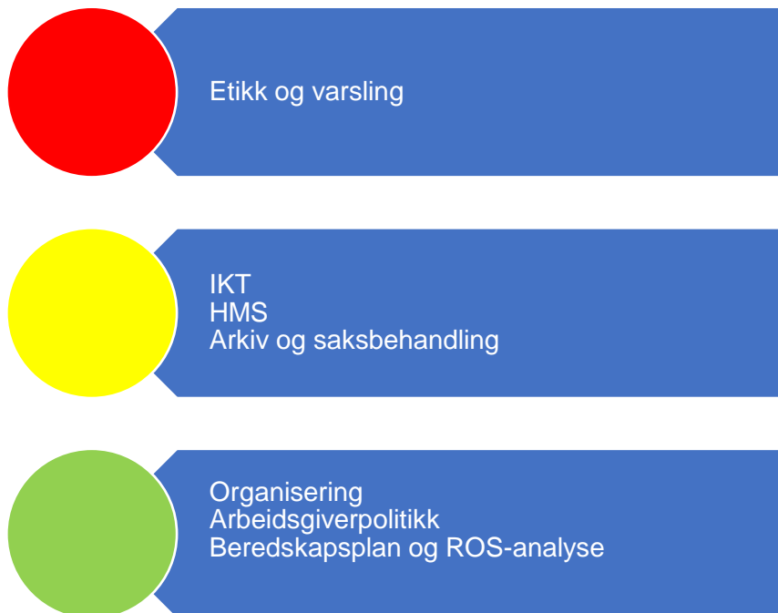
Figur 3. Risikovurdering organisasjon

I figur tre er risikovurderingen innenfor området organisasjon oppsummert og under følger en nærmere beskrivelse av data som er grunnlag for vurderingen.