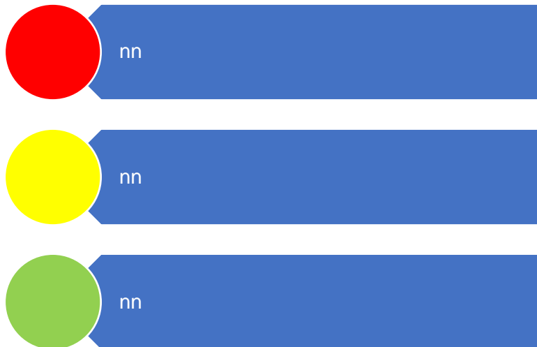
Figur 10. Risikovurdering

Risikovurderingene er oppsummert i figur to og visualisert som trafikklys. Vurderinger som fører til henholdsvis lav, middels og høy risiko plasseres der de hører til i figuren.