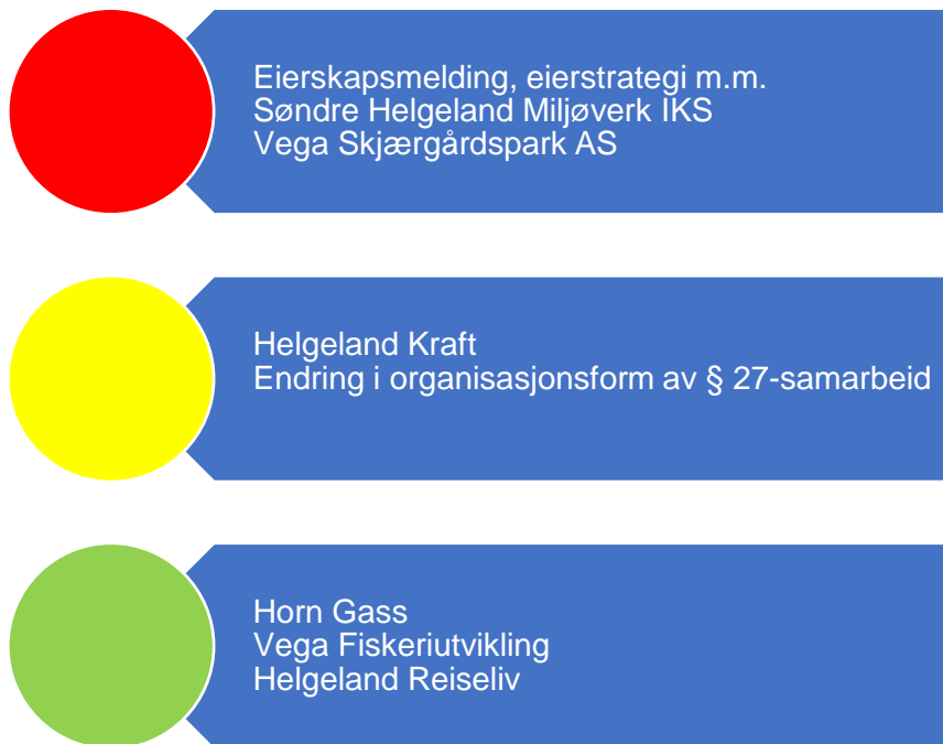
Figur 8. Risikovurdering eierskap

I figur 7 er risikovurderingene knyttet til kommune sine eierinteresser oppsummert og grunnlaget for vurderingene er nærmere vurdert i fortsettelsen. Selskaper som trekkes fram til å ha høy eller moderat risiko, bør få gjennomført både eierskapskontroll og forvaltningsrevisjon. Forvaltningsrevisjon i selskaper bør på generelt grunnlag undersøke selskapenes måloppnåelse både opp mot eiers ønsker og selskapets formål. Videre er selskapet i selskaper som er omfattet av dette, spesielt relevant. Selskaper som utøver viktige tjenester for kommunen bør få tjenesteutøvelsen revidert.