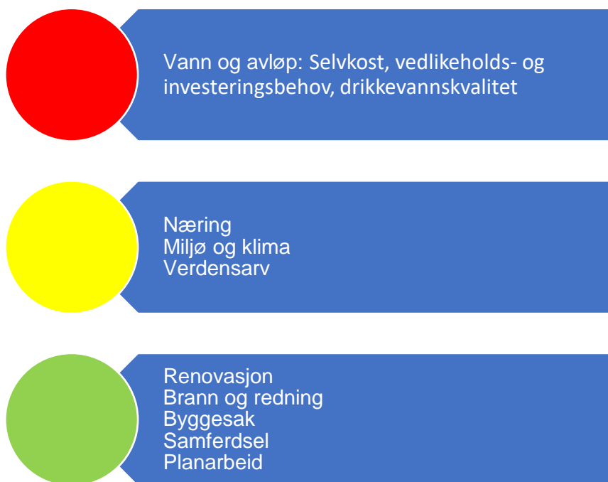
Figur 7. Risikovurdering teknisk

Figur 7 oppsummerer risikovurderingene innenfor teknisk drift. Under følger en nærmere beskrivelse av data som er grunnlag for vurderingen.