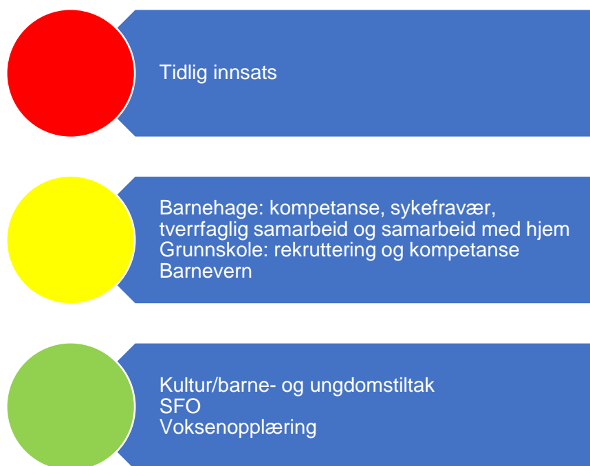
Figur 4. Risikovurdering oppvekst

Revisors samlede vurdering av risiko og vesentlighet relatert til oppvekst tilsier at risikoen er høy innen tidlig innsats. Det er mange elever med utfordringer, og skolen har ikke kapasitet til å møte disse på en god nok måte. Manglende ressurser til å takle utfordringer tidlig, vil ha store konsekvenser for elevers videre skolegang og arbeidsliv. Barnehage og grunnskole har blitt plassert i en moderat risiko. Det er utfordringer innen kompetanse og rekruttering, samt samarbeid med hjemmet. Revisor anser disse områdene for også å ha store konsekvenser, men ikke like store som den manglende ressurser til å håndtere tidlig innsats. Barnevern er også plassert i en moderat risiko. Dette på grunn av høye utgifter, og en vurdering av tjenesteområdet som utfordrende og som på et generelt grunnlag ikke bør plasseres i lav risiko. Området plasseres derfor i moderat risiko.