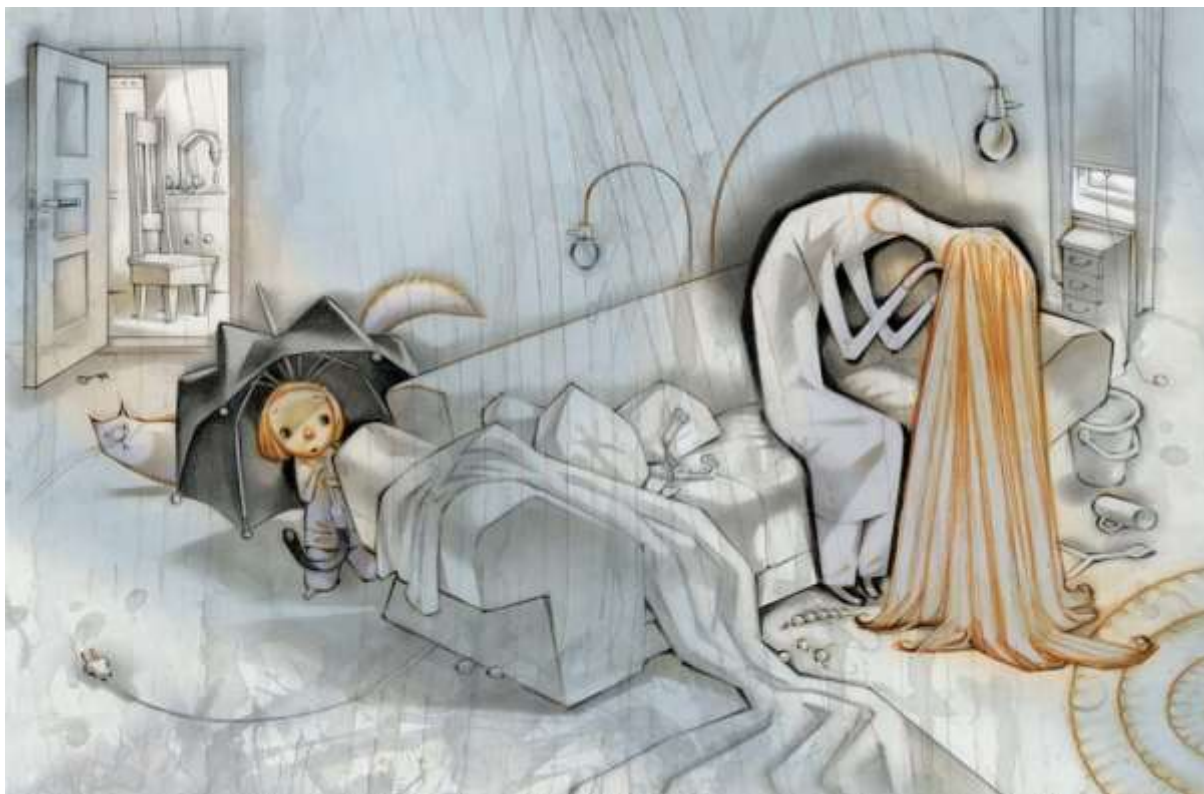
1 Illustrasjon: Svein Nyhus

Finn veilederen her: stinesofiesstiftelse.no → Juridisk bistand