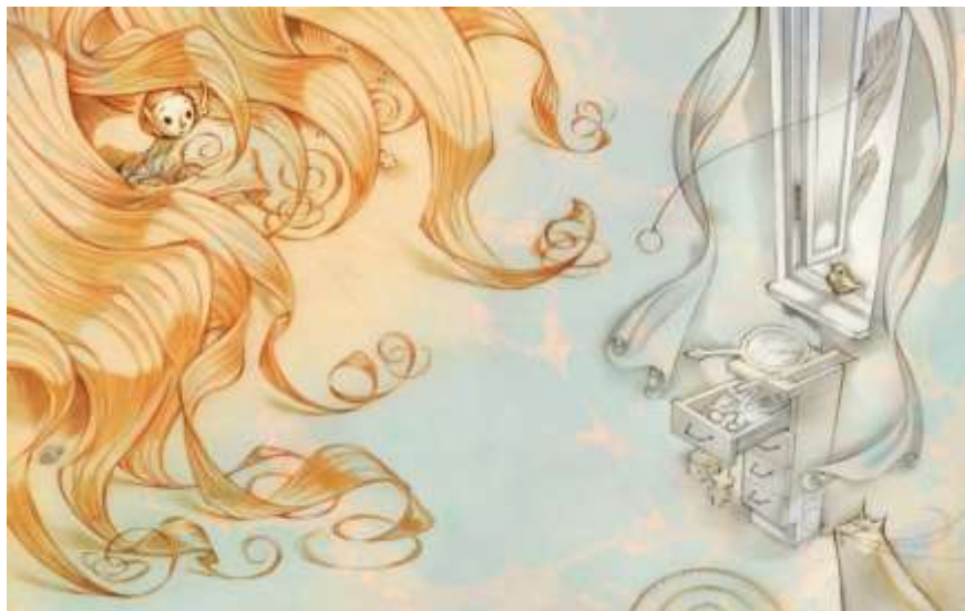
2 Illustrasjon: Svein Nyhus

Fagpersoner i offentlig sektor som jobber med barn og unge og deres familier anbefales å gjøre seg kjent med Barneverntjenesten Sør-Helgeland sin håndbok TRU for å få innsikt i organiseringen på Sør-Helgeland.