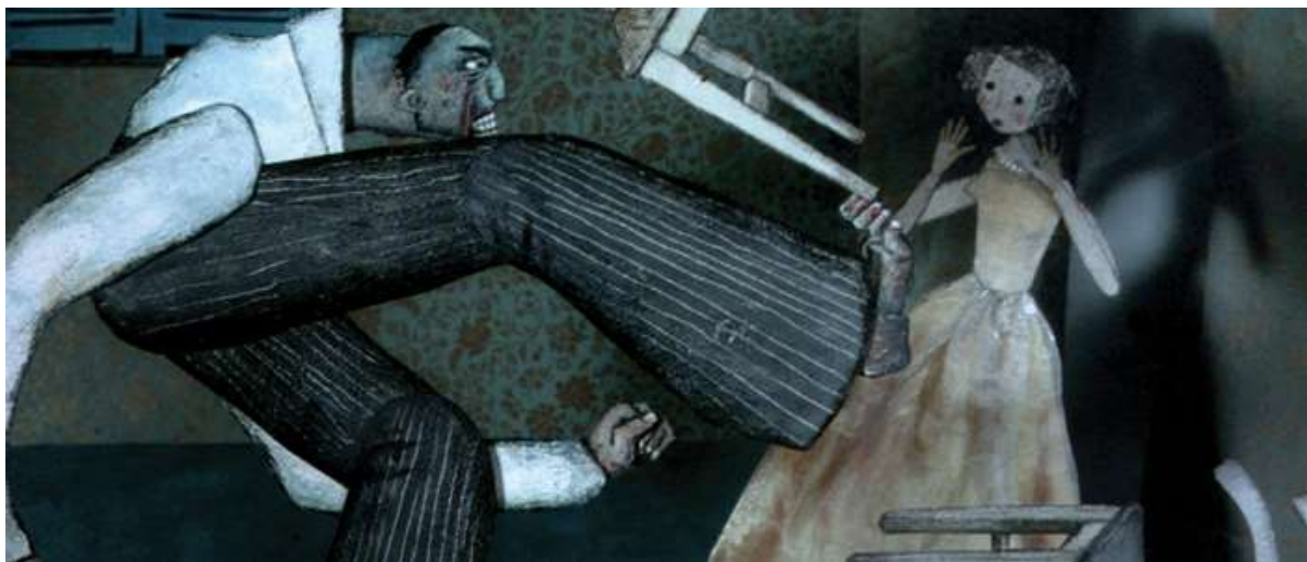
3 Illustrasjon: Svein Nyhus

Kilde: Siri Søftestad (2005): Seksuelle overgrep. Fra privat avmakt til tverretattlig handlekraft. Universitetsforlaget.